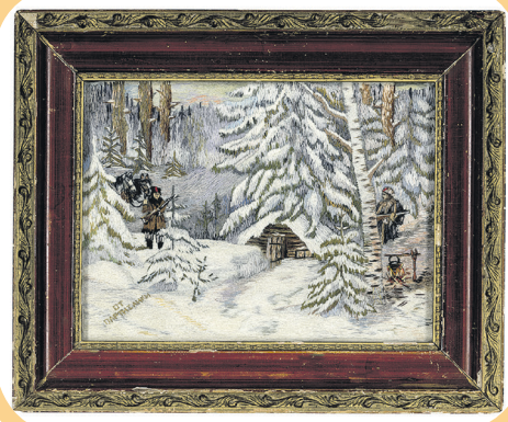
Вышивка А. Н. Захаровой

Привлекает внимание и небольшой ковер, на котором изображены пограничник с собакой. У этого экспоната удивительная героическая история. В довоенном Минске проходила выставка. Когда город оккупировали, фашисты приказали сгрузить все экспона-