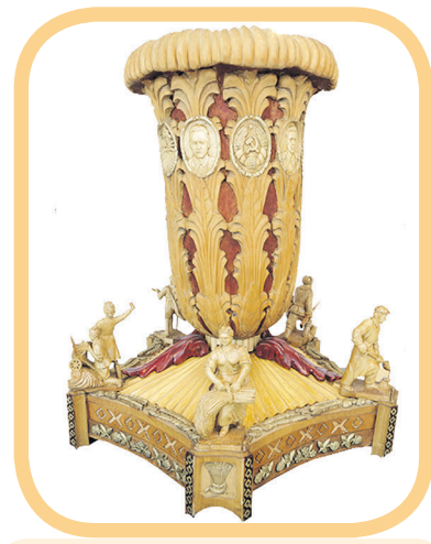
Декоративная ваза от воспитанников Чаусского детского дома

НИКОЛАЙ ШЕВЧЕНКО, ЧЛЕН БЕЛОРУССКОГО СОЮЗА ЖУРНАЛИСТОВ