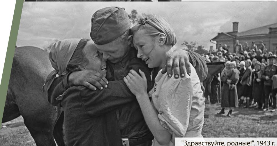
"Здравствуйте, родные!". 1943 г.