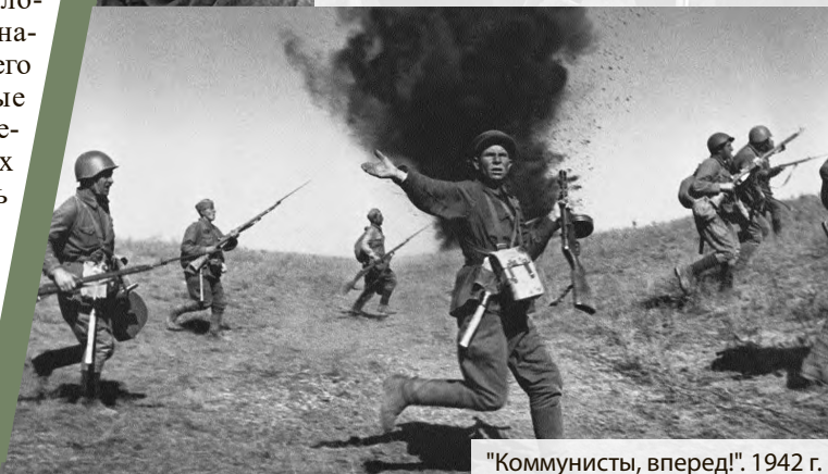
"Коммунисты, вперед!". 1942 г.