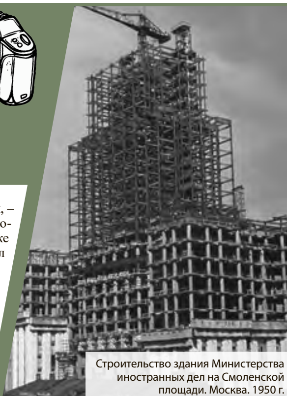
Строительство здания Министерства иностранных дел на Смоленской площади. Москва. 1950 г.